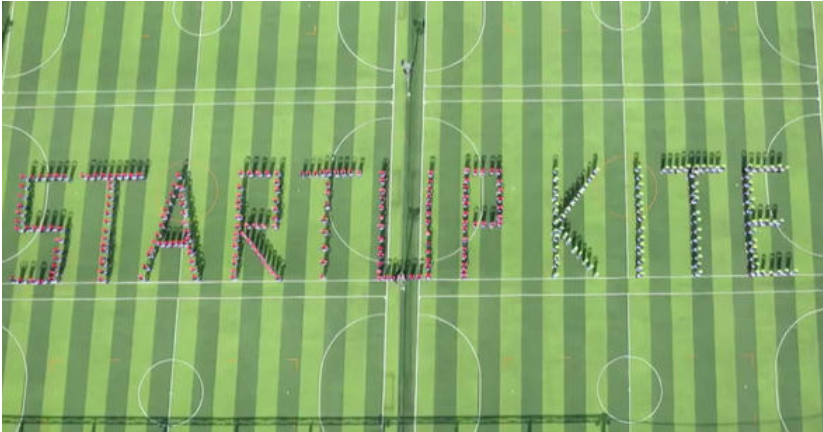
Sinh viên Trường cao đẳng Lý Tự Trọng TP.HCM xếp chữ tên cuộc thi Startup Kite tại buổi phát động.

Cuộc thi năm nay được Bộ Lao động - Thương binh và Xã hội tổ chức thành 3 vòng, gồm vòng sơ tuyển, bán kết và chung kết. Dự kiến lễ trao giải Startup Kite 2022 sẽ được tổ chức vào tháng 11/2022 tại TP. Hồ Chí Minh.