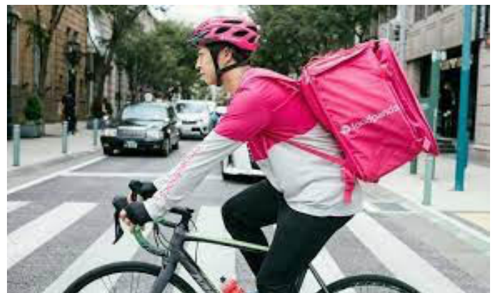
Delivery Hero - Công ty giao đồ ăn của Đức, đầu tư vào e-food.gr.

phòng với giá cả phải chăng. Trong khi đó, các nhóm VC bao gồm VentureFriends, Marathon Venture Capital và NBG Business Seeds, đang đẩy nhanh tốc độ phát triển các công ty khởi nghiệp với nguồn vốn giai đoạn đầu. Nhận được sự hỗ trợ này, các công ty khởi nghiệp có thể đóng một vai trò quan trọng trong quá trình phục hồi kinh tế của Hy Lạp. Họ có thể thu hút nhiều vốn đầu tư nước ngoài hơn, thu hút nhân tài có tay nghề cao và biến các thành phố đang gặp khó khăn thành tâm điểm của sự đổi mới giống như các quốc gia khác đã hoặc đang làm.