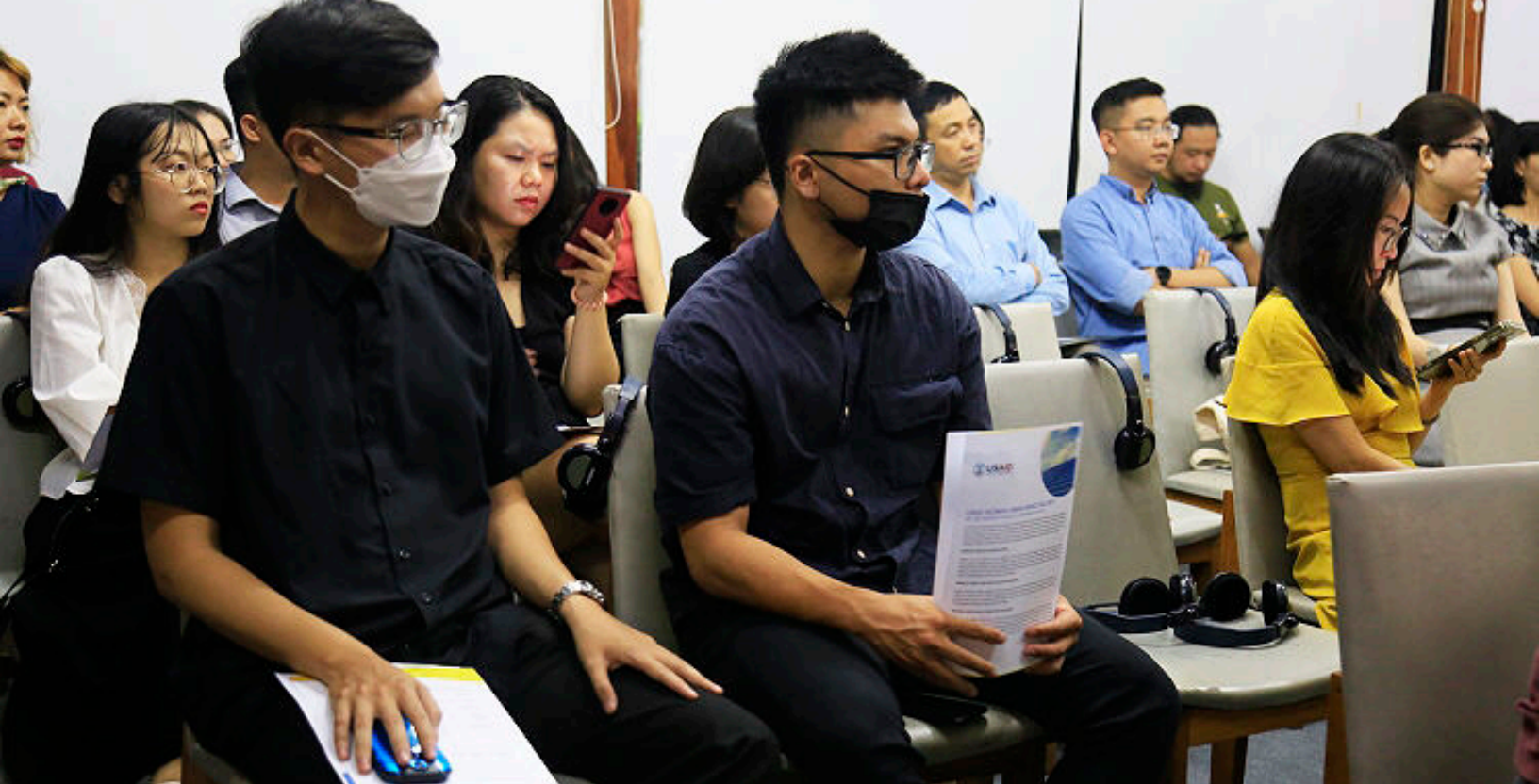
Sự kiện gặp gỡ “Đổi mới sáng tạo mở trong ngành năng lượng sạch” tạo cơ hội kết nối các đối tác doanh nghiệp và các công ty khởi nghiệp trong hệ sinh thái năng lượng sạch

“Các startup trong hệ sinh thái về năng lượng có hai nhóm chính, một là giải pháp về software (phần mềm), vốn quen thuộc ở Việt Nam, được hỗ trợ, đầu tư nhiều hơn. Thứ hai là nhóm về hardware (phần cứng) khó hơn, ít được sự đầu tư phát triển, hỗ trợ. Tôi thấy có sự lệch pha khi các startup thiên về dịch vụ, sản phẩm, B2B được chú trọng, dành nhiều hơn nguồn nhân lực cũng như các hỗ trợ đi kèm. Còn nhóm về hardware rất khó để tìm nguồn đầu tư, hỗ trợ vì cần vốn lớn, thời gian chờ đợi khá lâu. Gần đây, tôi mới thấy có sự chuyển biến khi nhận được nhiều sự hỗ trợ hơn, có những chương trình được thiết kế dành riêng cho startup về hardware, phần lớn để giải quyết các vấn đề môi trường”.