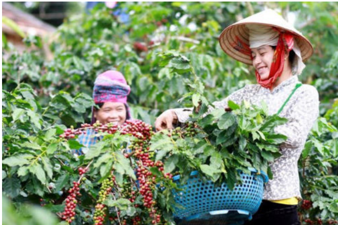
Các doanh nghiệp, hợp tác xã hoạt động và sử dụng lao động trên địa bàn các xã đặc biệt khó khăn thuộc vùng đồng bào dân tộc thiểu số, miền núi sẽ được hỗ trợ khởi nghiệp.

sau: Mỗi xã ĐBKK có tối thiểu 1 mô hình khởi sự kinh doanh, khởi nghiệp được hỗ trợ. Mô hình được hỗ trợ phải tạo việc làm, có hợp đồng thu mua sản phẩm cho ít nhất 15 hộ gia đình thuộc địa bàn xã khu vực III.