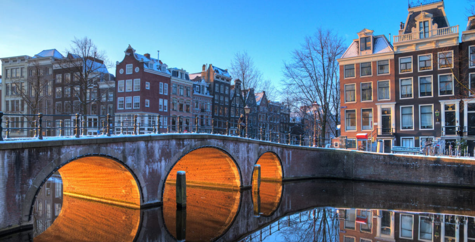
Liệu Thủ đô Hà Lan có thể bắt kịp các trung tâm khởi nghiệp hàng đầu của châu Âu, London và Berlin?

lâu đời trong việc tạo ra các hệ thống công nghệ như Python và Bluetooth.