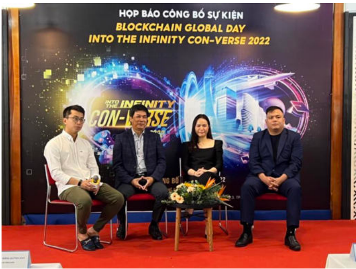
Ban tổ chức Blockchain Global Day 2022 họp báo sáng 7/7 tại SIHUB.