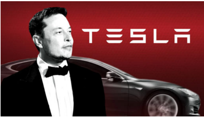
Hãng xe điện Tesla của Mỹ vừa trở thành nhà sản xuất ô tô lớn nhất thế giới tính theo giá trị vốn hóa.

Lấy Elon Musk làm ví dụ. Sau khi gây dựng sự nghiệp của mình với tư cách là một doanh nhân phần mềm, ông thành lập SpaceX vào năm 2002, nhằm mục đích giảm chi phí du hành vũ trụ đủ để một ngày nào đó có thể chiếm đóng sao Hỏa. Khi ông khởi động dự án và bắt đầu hoạt động - chuyển sang giai đoạn hoạt động - thì dự án tạo ra một chiếc xe chạy bằng điện đã thu hút sự chú ý của ông. Ông đã đầu tư vào Tesla, trở thành chủ tịch và dẫn đầu các nỗ lực gây quỹ của công ty.