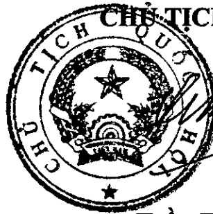
Trần Thanh Mẫn